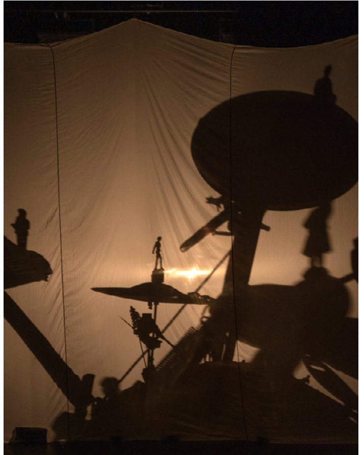
Photos issues de la résidence au CCAM, Scène nationale de Vandœuvre-lès-Nancy en septembre 2023

Un grand tissu blanc se déploie depuis le milieu de la scène.