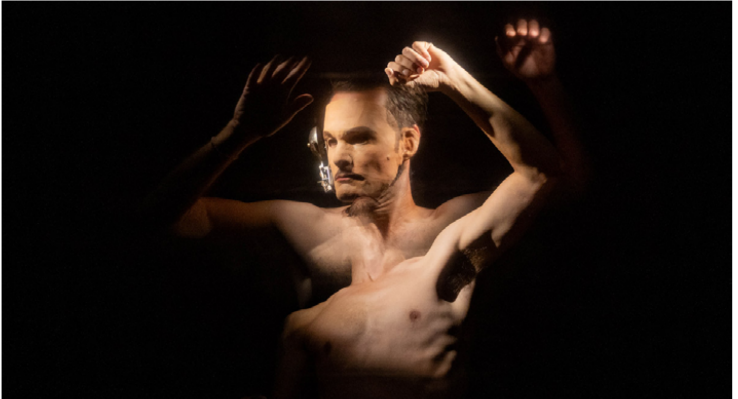
Photo issue de la résidence au CCAM, Scène nationale de Vandœuvre-lès-Nancy en septembre 2023

Le plateau délimitant l'espace scénique tourne sur lui-même et le personnage passe dans la salle de bain, face à son miroir au travers duquel le public peut le voir.