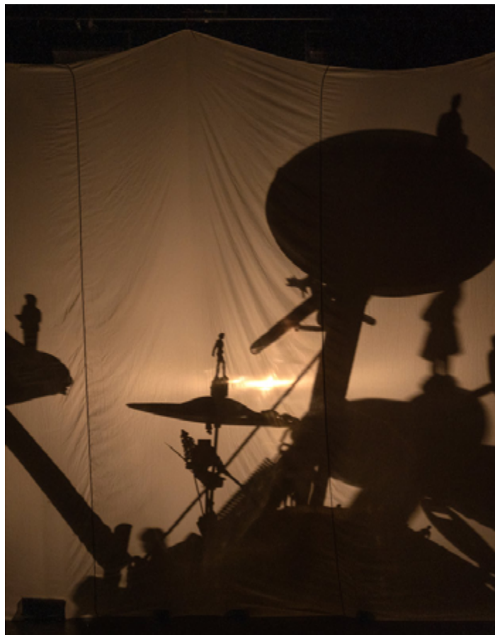
Photos issues de la résidence au CCAM, Scène nationale de Vandœuvre-lès-Nancy en septembre 2023

Un grand tissu blanc se déploie depuis le milieu de la scène.