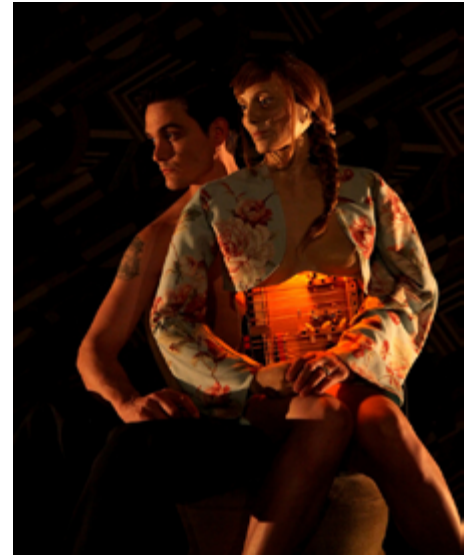
masque et prothèse dans l'Un dans l'autre