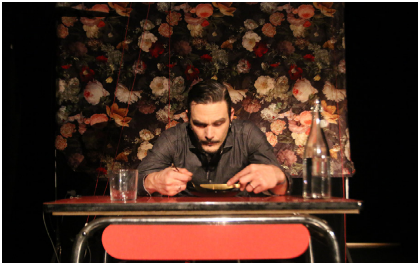
Photo issue de la résidence au CCAM, Scène nationale de Vandœuvre-lès-Nancy en février 2023