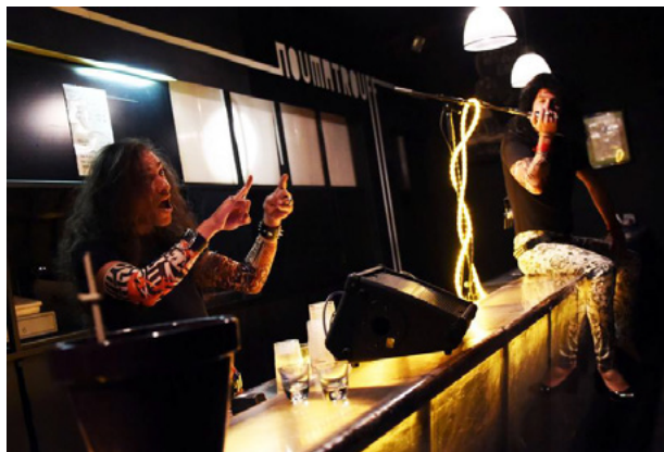
La bar a morflé avec la compagnie Chat'Pitre.

DNA Dernières Nouvelles d'Alsace 25 octobre 2018