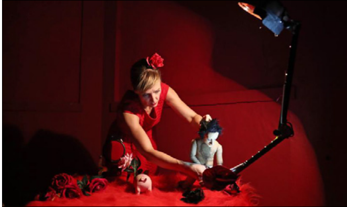
« Fais-moi mâle », par la C ie La Mulette, l'histoire sans parole d'une étrange métamorphose.

La compagnie Kalisto, initiatrice de ce festival de micro-théâtre à la fois léger et accessible, a investi cette année le Noumatrouff, dont les res-