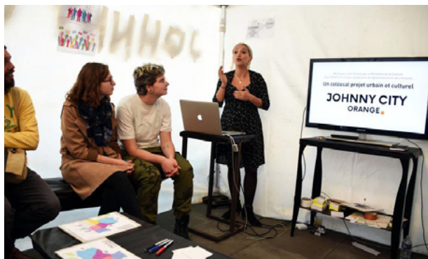
Simulacre de démocratie participative avec Kalisto.