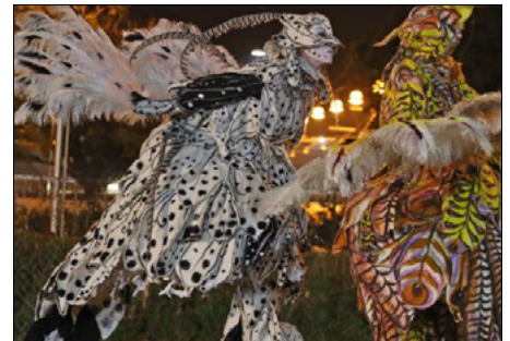
Vendredi, c'est Quartier de Nuit qui a ouvert les « after ».

VOIR Vidéo et galerie photos sur le site www.lalsace.fr ; Programme détaillé de la Nuit des compagnies sur www.billletterie.compagniekalisto.org