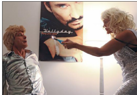
« La nuit où tout a basculé », par la C ie El Paso.

sources scéniques sont multiples. Le Nouma comme vous ne le connaissez pas, coulisses, loges, studios, vestiaire, bar et même grande salle en guise de « hall d'embarquement » le tout totalement relooké « Johnny, avec salon, soupe au potimarron et cocktail « Saint-Barth' », yeah !