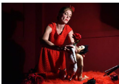
Le coup de cœur de cette édition 2018 : la compagnie nancéenne La Mue/tte.