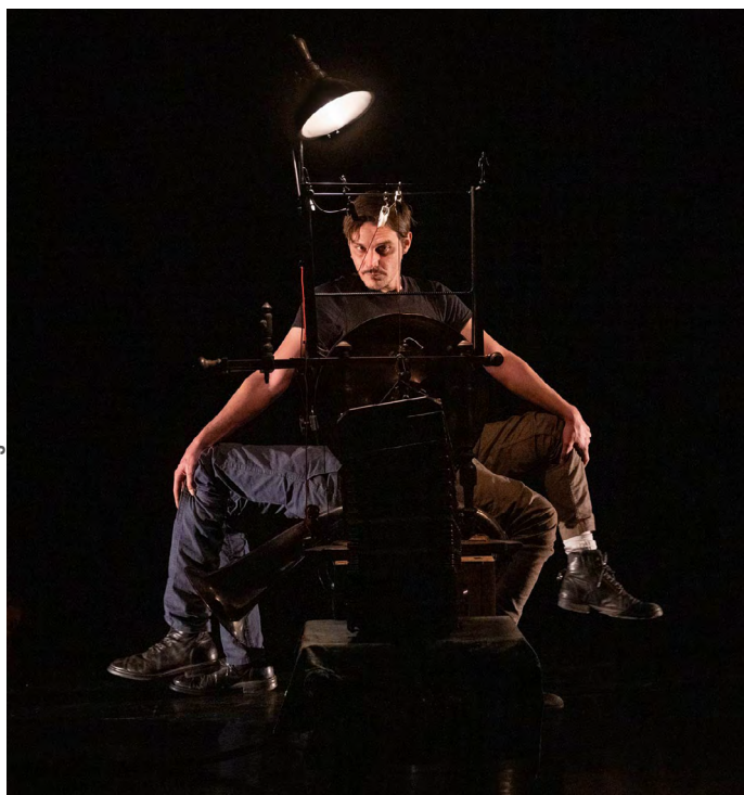
Résidence avril 2024

Le masque déporté à l'arrière de la tête met en images l'émotion du personnage : il est littéralement en désordre, "la tête à l'envers".