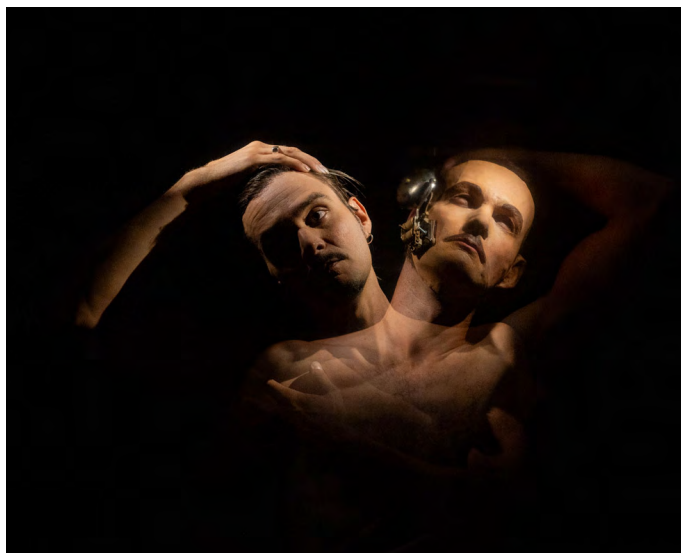
Résidence septembre 2023

Les petites anomalies rendues possibles par la manipulation magique contribuent à dessiner un univers singulier à la frontière onirique du fantastique et du réel.