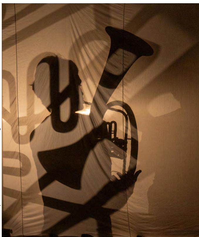
Résidence septembre 2023

Mais surtout, l'ombre offre un traitement visuel déréalisé et qui peut laisser le doute sur ce qui est montré. Réalité ou fantasma ? Sort-il réellement à l'extérieur ou rêve-t-il inlassablement qu'il va affronter le monde ?