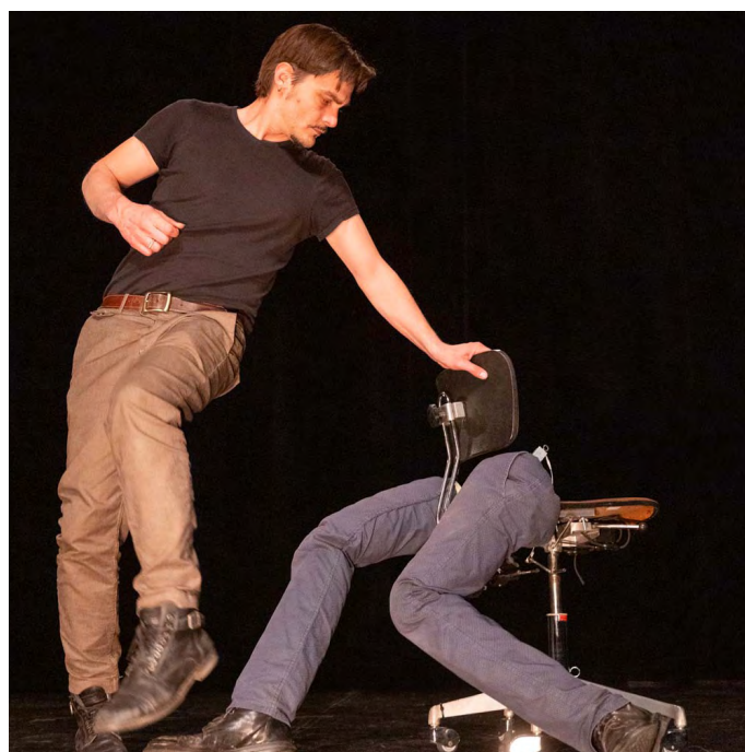
Résidence avril 2024

Les jambes automatiques sont un point d'orgue du principe de dissociation de ce musicien atypique : tout d'abord homme-chimère, mutant augmenté, il démultiplie ses membres et se crée une anatomie aussi complexe que le sera sa partition musicale. Jusqu'à la dissociation complète, où, en toute autonomie, ses jambes pourront le quitter ou l'emmener dans un pas de deux irrésistibles.