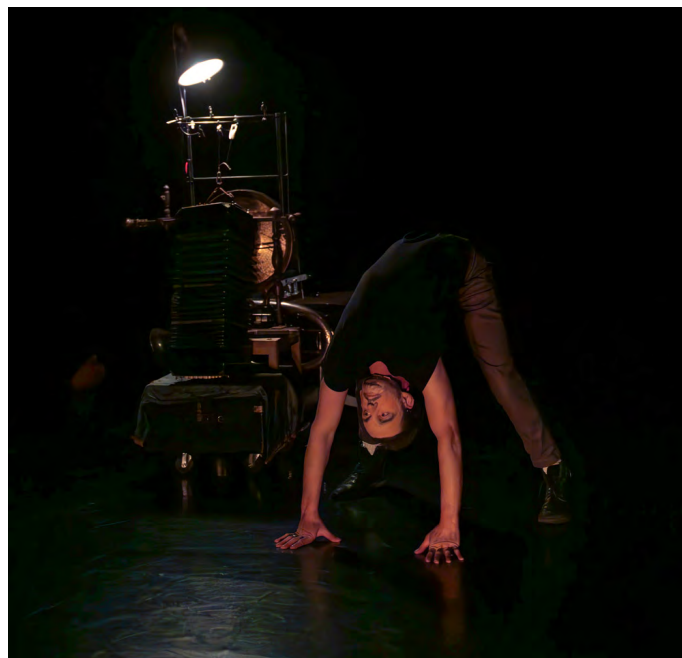
Résidence avril 2024

Les jambes automatiques sont un point d'orgue du principe de dissociation de ce musicien atypique : tout d'abord homme-chimère, mutant augmenté, il démultiplie ses membres et se crée une anatomie aussi complexe que le sera sa partition musicale. Jusqu'à la dissociation complète, où, en toute autonomie, ses jambes pourront le quitter ou l'emmener dans un pas de deux irrésistibles.