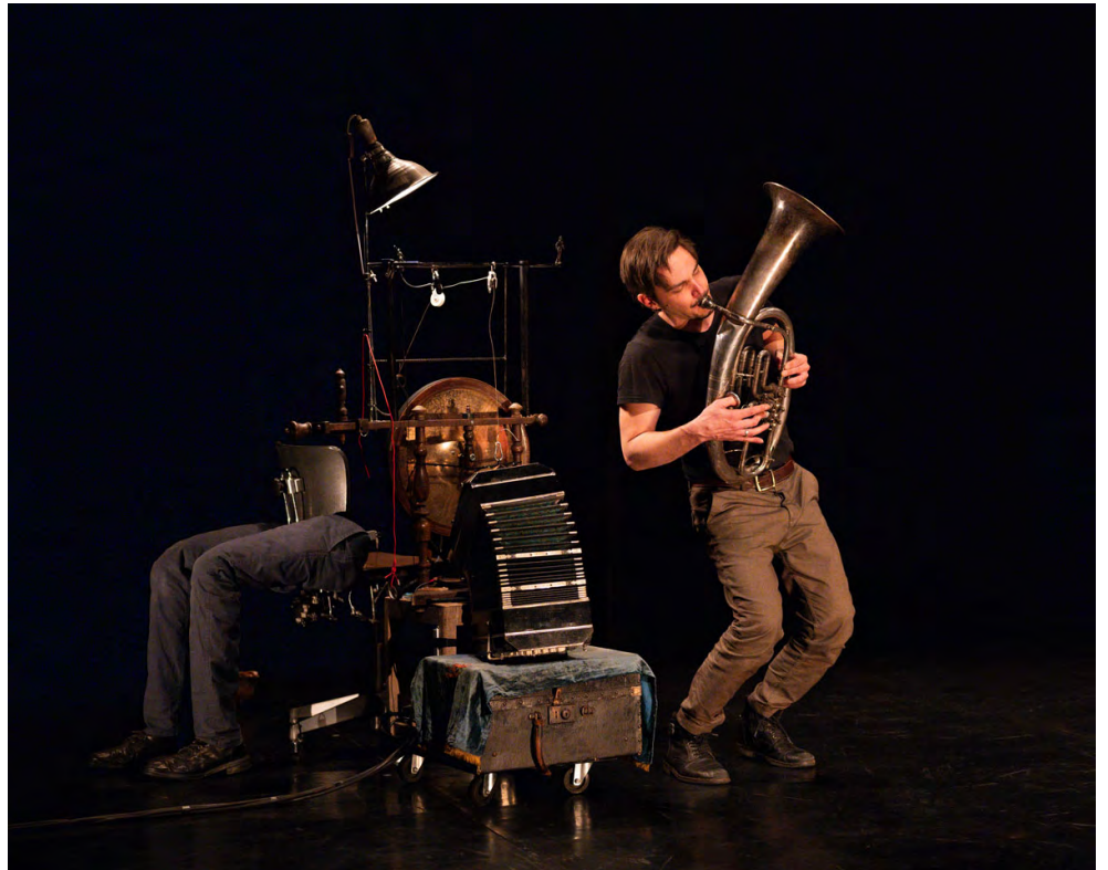
Résidence au TGP de Frouard – avril 2024

Le son enregistré de la rue et de l'environnement extérieur sera le fruit d'une recherche et d'une collecte d'instantanés sonores furtifs, captés dans la ville.