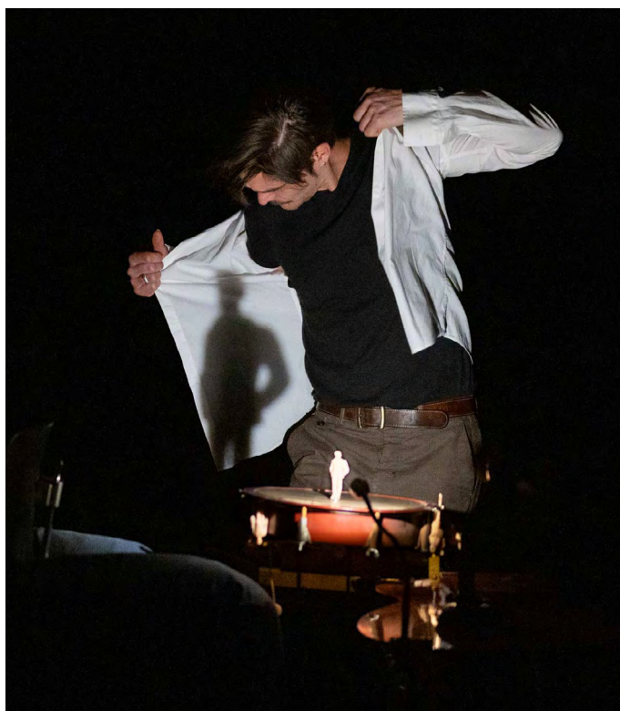
Résidence avril 2024

Le jeu possible des échelles visuelles accompagne la joute sonore entre la musique et le son de la ville. La silhouette du musicien et de son orchestre peut grandir au gré du volume sonore, en nous livrant une image poétisée de cette lutte bruyante qu'il faut mener pour exister dans la foule.