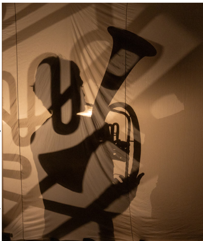
Résidence septembre 2023

Mais surtout, l'ombre offre un traitement visuel déréalisé et qui peut laisser le doute sur ce qui est montré. Réalité ou fantasme ? Sort-il réellement à l'extérieur ou rêve-t-il inlassablement qu'il va affronter le monde ?