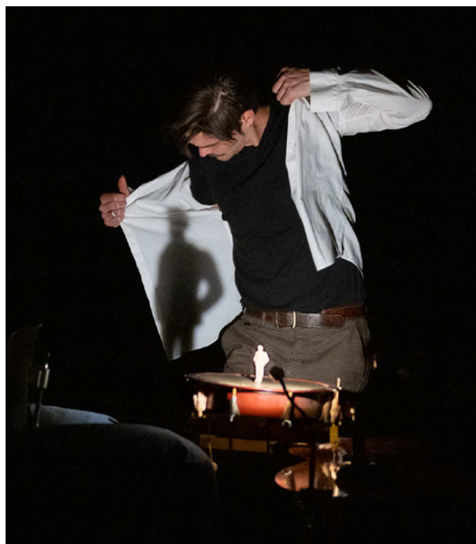
Résidence avril 2024

Le jeu possible des échelles visuelles accompagne la joute sonore entre la musique et le son de la ville. La silhouette du musicien et de son orchestre peut grandir au gré du volume sonore, en nous livrant une image poétisée de cette lutte bruyante qu'il faut mener pour exister dans la foule.